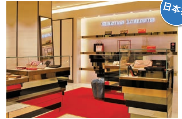
1階「クリスチャンルブタン」バッグコーナー