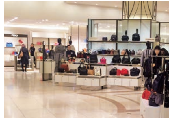
1階「バッグギャラリーズ」