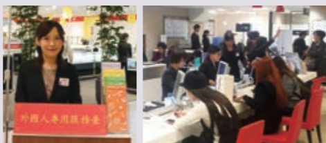
←ニューヨークフェア2015

年々増え続ける外国人観光客に向けた、おもてなしも充実。お花見やGWなど数多くご来店される際には、免税カウンターも増設し、専用のご案内スタッフもお出迎え。