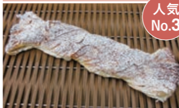
塩パン マーガリンを巻き込み、フランス・ゲランドの塩をふって焼き上げました！