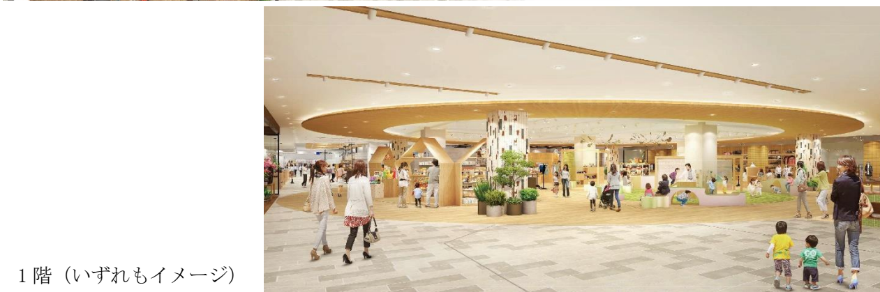
1 階（いずれもイメージ）

1 階には、高槻子育てファミリーの集いの場として「たかつき けやき広場（仮称）」を2023 年秋に設置予定（約 180 m 2 ）。