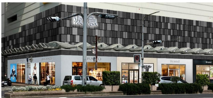
新館 1 階 外観

異なる要素をミックスし 1 つにすることで生まれる新しいモードな体験により、心躍る豊かな日常を提供する、約 2,500 ㎡の売場が 8 月 31 日に誕生します。本館とは独立した環境で、ファッションだけでなく、インテリア、カフェなど、「モード」を暮らしのアクセントとして取り入れる神戸流モードライフを提案します。