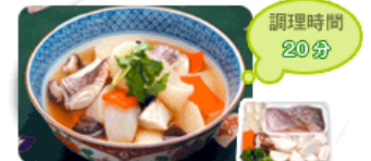
鯛とかぶらの煮物

1,000種類以上のレシピをご用意し、レシピに必要な全ての材料がワンクリックで注文できる『 レシपी一括注文 』、いつも注文するお気に入りの商品を登録し、毎回簡単に注文できる『 マイセット 』など、web経由の受注体制を強化。通勤途中にスマートフォンで注文など、都市生活者のライフスタイルを考慮しました。