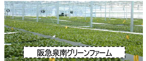
阪急泉南グリーンファーム