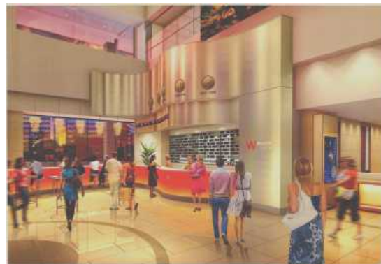
1階 ウエルカムホール 「ウエルカムカフェ」

さらに、各階ではワールドごとのお客様像にふさわしい売場環境デザインを導入し、お客様の気分を高めます。また、全館にわたって、女性の肌がキレイに見える照明を導入し、おしゃれ選びが楽しめます。