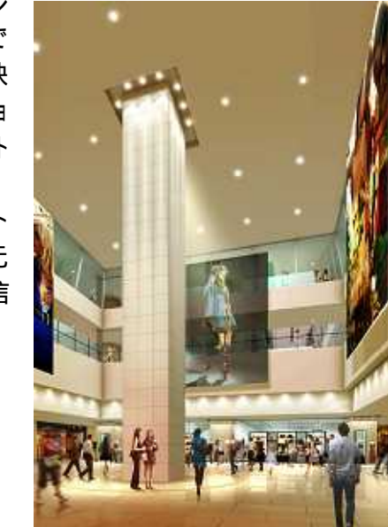
1階 ウエルカムホール 「ウエルカムビジョン」