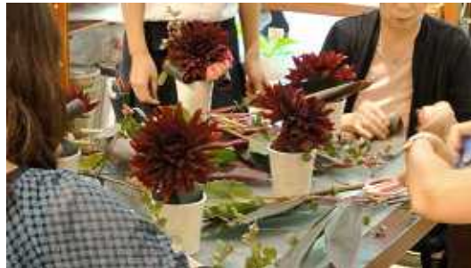
コトコトステージ

「私の作品を皆に見てほしい」、「同じ趣味を楽しむ仲間に出会いたい」...そんなお客様の思いをかなえる場。ステージ発表や作品展示、気軽に試せるワークショップやミニセミナーなどの学べるイベントを開催します。