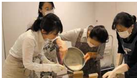
手づくりせっけん教室の様子