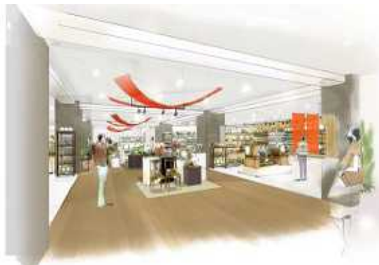
イベントスペース

さらに“快眠”に欠かせない枕は約90種類を集め、試眠ベッドや、素材の違いを手で触って試せるタッチピローなどの体験・体感スペースを設けて、お一人おひとりに合った品選びがスムーズです。