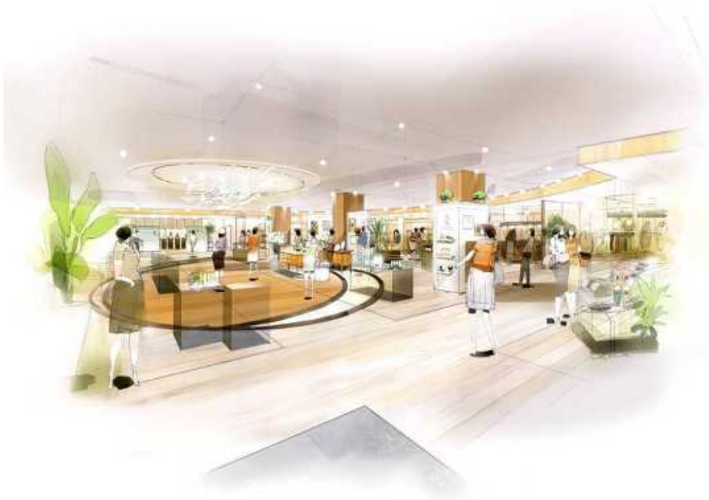
美と健康のゾーン

また、『ハートニングハウス』では、快適な暮らしをサポートするアイテムが揃います。