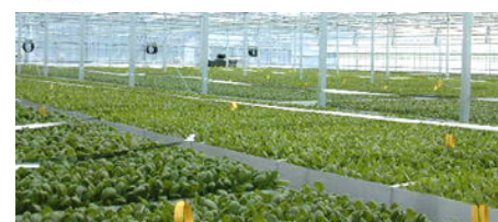
阪急泉南グリーンファーム