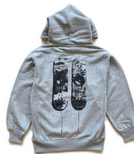
「dajac」 Skateboard Speaker