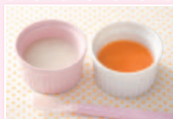
[初期]…生後5～6ヶ月 にんじんスープセット