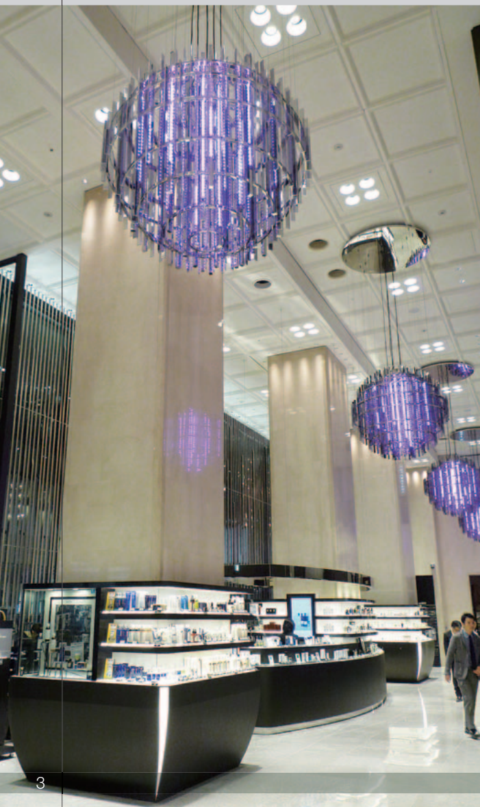
1F入口の吹き抜けが快適な空間を提供

そして、2～3階ではビジネスシーンのドレスアップスタイルから、休日のカジュアルスタイルまで、彼らの洗練されたライフスタイルにふさわしいファッションを提案・発信していきます。