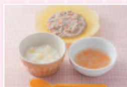
[後期]…生後9～11ヶ月 鶏レバーミルク煮セット