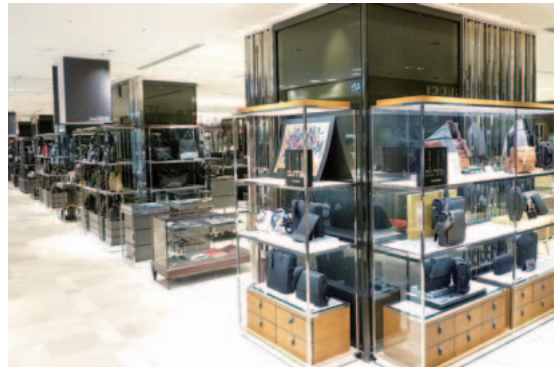
1F インターナショナルラゲージ&レザーグッズ