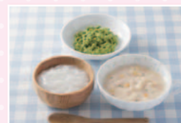
[中期]…生後7～8ヶ月 クリームシチューセット