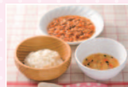
[完了期]…生後12～18ヶ月 ビーフトマトシチューセット