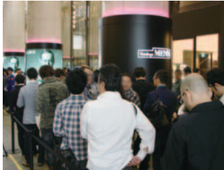
オープン当日開店前の様子

開業当日は開店前から多くのお客様にご来店いただき、期待の高さを実感するとともに、まずは好調なスタートを切ることができたと思っております。これからも高感度で話題性の高いメンズスペシャリティストアとして、全国に向けて男性のおしゃれを発信し続ける店にしていきたいと考えています。