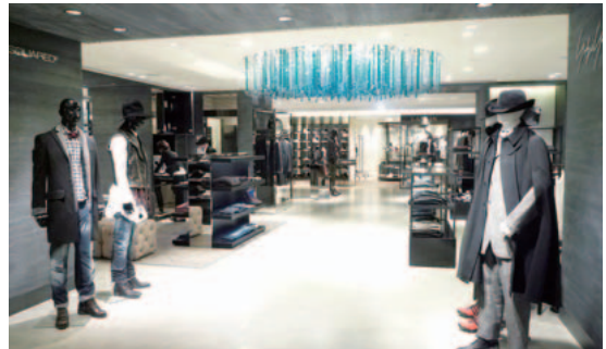
2F インターナショナルデザイナーズ/リゾート&カジュアルスタイル