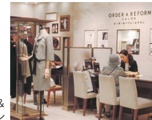
オーダー & リフォームサロン

素材の良さや着心地にこだわり、自分好みの、自分だけの服を求める方々に向けて、従来のフルオーダーだけでなく、パターンオーダーを導入。4人のデザイナーのコレクション(約30型)のスペシャルなラインナップは魅力です。