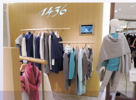
フォーティーン サーティシックス

上質なニットなど一部のアイテムに特化して提案する上質アイテムゾーン。最高級カシミアを使ったブランド「1436(フォーティーンサーティシックス)」が新しくオープンするなど注目です。