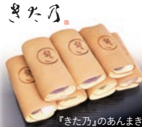
『きた乃』のあんまき