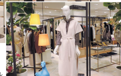
プレミアムカジュアル