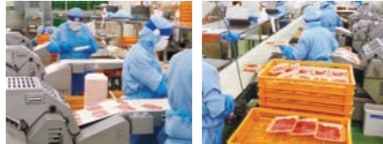
食肉のスライスやパッキング、値付けの作業を行っています

7月1日、大阪市住之江区に生鮮食品の加工・販売を行う(株)阪急フードプロセスを設立し、阪急オアシス・イズミヤの店舗へ商品を提供しています。今後も順次導入を拡大し、物流の効率化を図ってまいります。