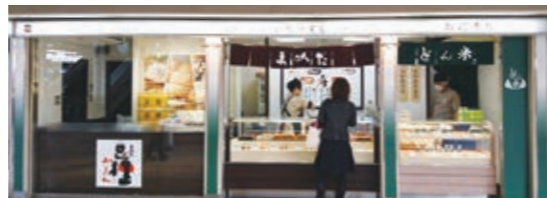
阪急十三駅構内にある『豆狸』と『どん米』の複合型ショップ

主力ブランドのひとつ『豆狸』は、40数年の歴史を誇るいなり専門店。今年は高速道路のサービスエリアへ出店したほか、おにぎりの『どん米』や和菓子の『きた乃』など、異なるカテゴリーとの複合型ショップを展開しています。商圈に応じた店舗を開発し、収益規模の拡大を図ります。