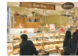
阪急オアシス茨木大手町店の『阪急ベーカリー 香房』

また、新たに洋菓子の商品開発にも取り組んでいます。サクサクでとろっとした食感が楽しい『エッグタルト』や、ご注文をいただいてから自家製カスタードクリームを詰める『ダックワーズ・シュー』など、トレンドやお客様のニーズをふまえた商品がご好評をいただいています。