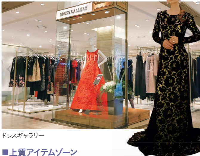
ドレスギャラリー

晩餐会やガラパーティー、カジュアルなガーデンパーティーなど様々なシーンに対応できるドレスを26ブランド約200着ご用意。オートクチュールも手がける最高級ブランドや、4大コレクションへ出展している海外セレブ愛用のメゾンブランドなど幅広い品揃え。また雑貨やアクセサリーも取り揃えており、パーティーの準備はすべてここで解決できます。