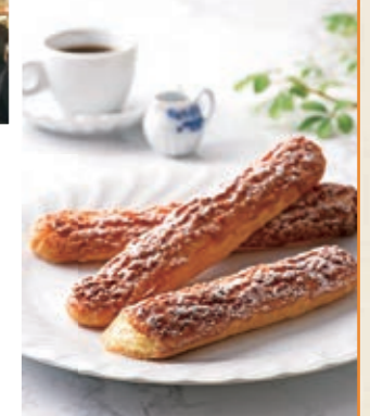
ダックワーズ・シュー