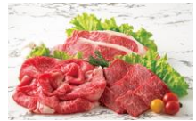
「匠のすこやか牛」 (国産交雑種)