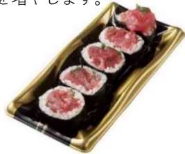
「まぐろどっさり太巻」 1個 598円（税抜き）

仕事帰りのついで買いや夕食の準備時間がないときなど時短に便利な惣菜を拡充しました。なかでもおすすめるは、シャリと具材の配分を見直し、シャリよりも新鮮なまぐろを贅沢に使用した「まぐろどっさり太巻」と、国産の豚ひき肉と野菜をふんだんに使用し、ジューシーな食感を実現させた「2層のがつつりメンチカツ」です。「どっさり太巻」はシリーズ化し、順次種類を増やします。