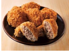
「2層のがつつりメンチカツ」 1個 158円（税抜き）