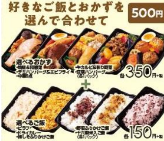
「選べるご飯+選べるおかず」 計500円（税抜き）

その他、おかずとサラダをセットにした店内手づくりの鮮度感あふれる「おかずサラダ」も展開しています。