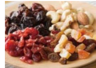
ドライフルーツ&ナッツ

おいしく健康をテーマに、無添加や有機原料にこだわったドライフルーツやナッツをコーナー展開します。また、鮮度の良い野菜を、毎日の献立にも役立つレシピでご紹介をしながら取り揃えます。