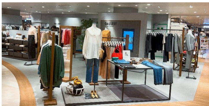
「ギャレスト バイ インディヴィ」