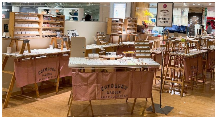
「コトモノマルシェ」