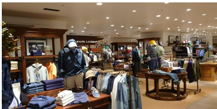
「ポロラルフローレン」