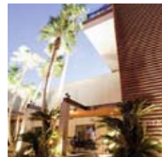
WITH THE STYLE イメージ