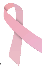
ピンクリボン シンボルマーク

“女性にいつまでも健康で美しくあってほしい”…博多阪急のそんな願いをカードに託し、オープン日までのカードご入会者数に応じて、乳がん撲滅に向けた啓発活動に寄付をします。